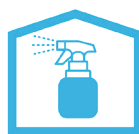
消毒用アルコールの設置 室内の除菌を徹底